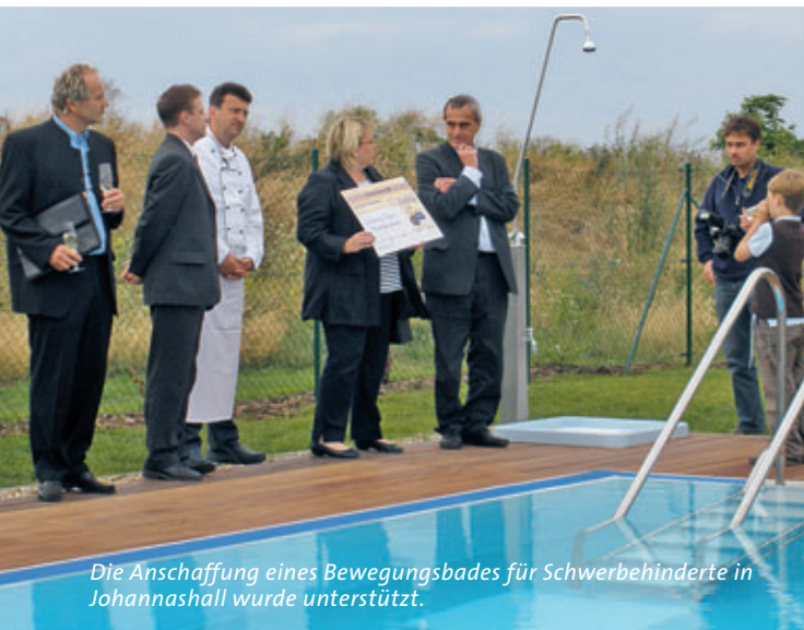
Die Anschaffung eines Bewegungsbades für Schwerbehinderte in Johannashall wurde unterstützt.

Haben Sie Lust uns kennen zu lernen und uns neben Ihrer beruflichen Tätigkeit zu verstärken? Dann nehmen Sie bitte einfach Kontakt mit uns auf.