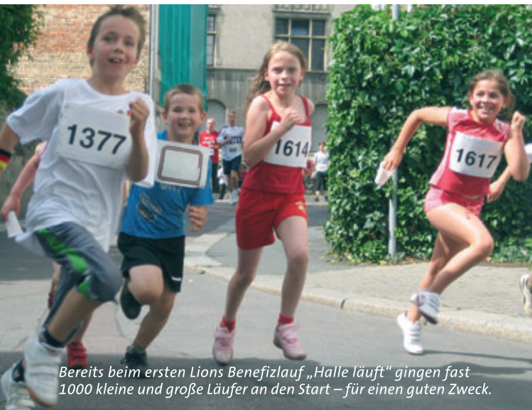
Bereits beim ersten Lions Benefizlauf „Halle läuft“ gingen fast 1000 kleine und große Läufer an den Start – für einen guten Zweck.